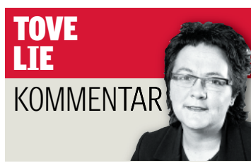
TOVE LIE KOMMENTAR